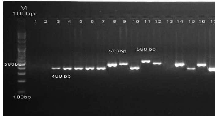
a. Primer ITS 1-2