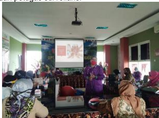
Gambar 5. Pelatihan Kader Tahap Ke 2

Kegiatan kedua pada tanggal 09 Oktober 2020 di Ruang Pertemuan Puskesmas Kassi Kassi yang dihadiri oleh 10 orang kader, Bidan dan petugas surveilans.