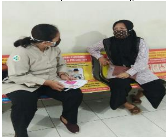
Gambar 7. Evaluasi Akhir kegiatan bersama bidan, kader dan ibu hamil di ruang ANC Puskesmas Kassi Kassi

Kegiatan di Ruang Antenatal Puskesmas Kassi-Kassi yaitu evaluasi akhir kegiatan berupa Refleksi Diskusi bersama Bidan, Kader Posyandu dan Ibu Hamil. Dapat disimpulkan bahwa Program VCT telah tersosialisasi pada kader posyandu, dan seluruh kader yang telah dibina mampu menyampaikan pesan tentang manfaat VCT kepada Ibu hamil dengan benar.