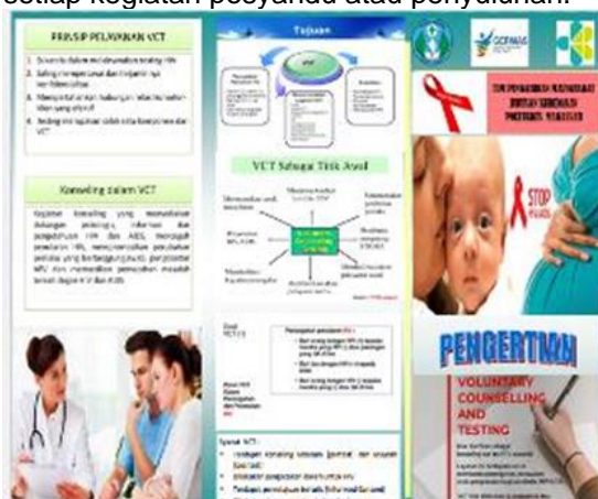
Gambar 2. Modul

Luaran dari kegiatan PkM ini adalah Adapun produk atau luaran yang direncanakan akan dibuat sebagai hasil dari pelaksanaan kegiatan pengabdian kepada masyarakat ini berupa Laeflet yang memuat informasi dan pengetahuan praktis yang dapat dijadikan pedoman oleh kader dalam menyampaikan informasi manfaat layanan VCT HIV kepada ibu hamil, keluarga dan masyarakat dalam setiap kegiatan posyandu atau penyuluhan.