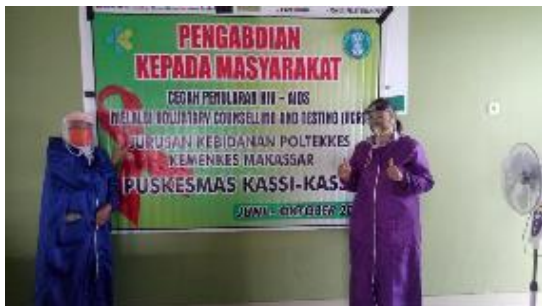
Gambar 1. Spanduk kegiatan PKM Permasalahan mitra sebagai berikut:

Program Kemitraan Masyarakat (PKM) yang telah dilaksanakan bermitra dengan bidan dan kader posyandu di wilayah kerja Puskesmas Kassi - Kassi Kota Makassar.