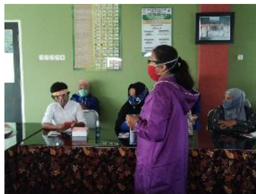
Gambar 6. Penyuluhan oleh kader dan tim pengabmas di ruang ANC

Bentuk evaluasi dan monitoring keberhasilan kegiatan pengabdian masyarakat sedianya akan dilaksanakan pada kegiatan posyandu dalam bulan oktober 2020, dialihkan melalui penguatan pengetahuan ibu hamil di ruang pemeriksaan kehamilan Puskesmas Kassi-Kassi. Hal ini karena masih dibatasinya pengumpulan orang sebagai bentuk sosial distancing selama masa pandemi covid 19.