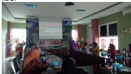
Gambar 4. Pelatihan Kader di Ruang Pertemuan Puskesmas Kassi Kassi

Pada kegiatan ini disampaikan materi oleh tim pengabmas tentang manfaat layanan VCT HIV bagi ibu hamil sebagai bentuk upaya deteksi dini dan pencegahan penularan HIV AIDS.